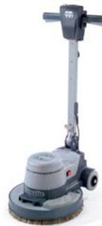
NRT1530HD Ref : 704577