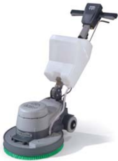
NR1500S Ref : 704556