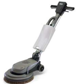
NLL415 Ref : 704490