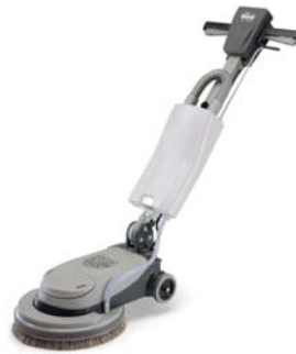
NLL332 Ref : 704485