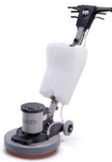
BMD1000S-P (Réservoir + Plateau) Ref : 875856