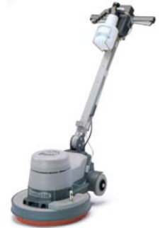
NRS450 Ref : 704583