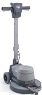
NS4503 Ref : 704403