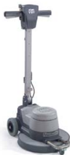
NRU1500 Ref : 704572