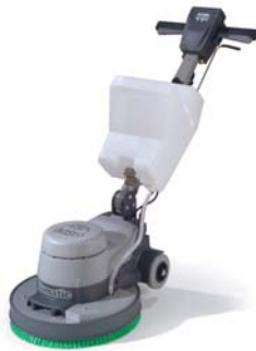
NR1500H Ref : 704567